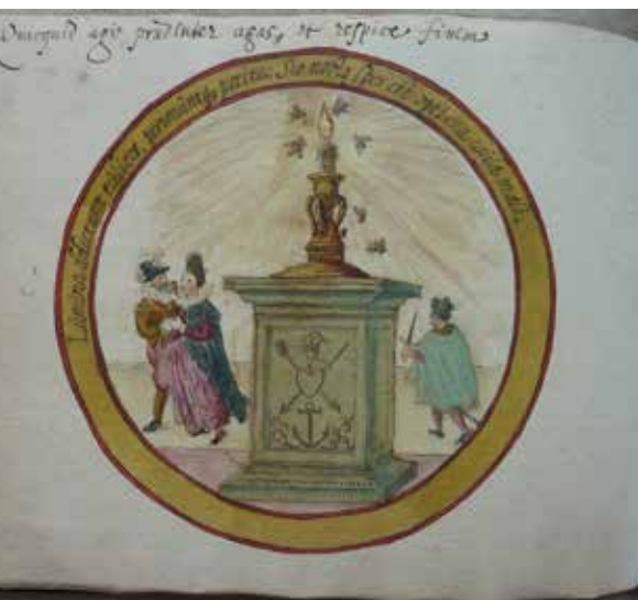
De mug en de kaars in het album van Henrica van Arnhem.