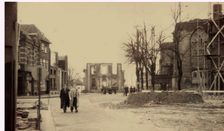
Doetinchem na de bombardementen, in mei 1945, vanuit de Heezenstraat naar de Markt, met onder andere het verwoeste stadhuis en de Catharinakerk.